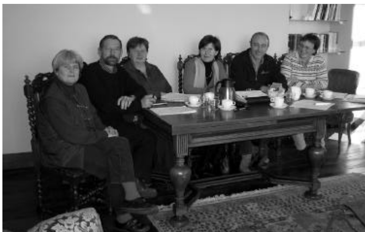
Le Comité lors d'une réunion à la Ferme du Chant d'Oiseaux